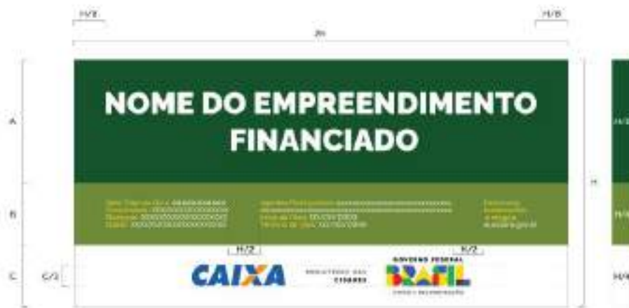
Figura 01- Modelo de Placa de Obra

Deverá ser instalada junto ao canteiro de obras, fixadas de maneira a oferecer segurança contra ventos, etc., com todas as informações necessárias ao atendimento das exigências legais.